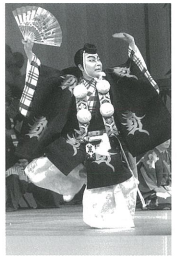
藤川矢之輔

延年の舞 芳柁柁 村家屋 辰彌勝 三郎佑彦 藤川矢之輔 (劇団前進座) 柁柁柁 屋屋屋 五勝勝 助進十 助良朗 (囃子)